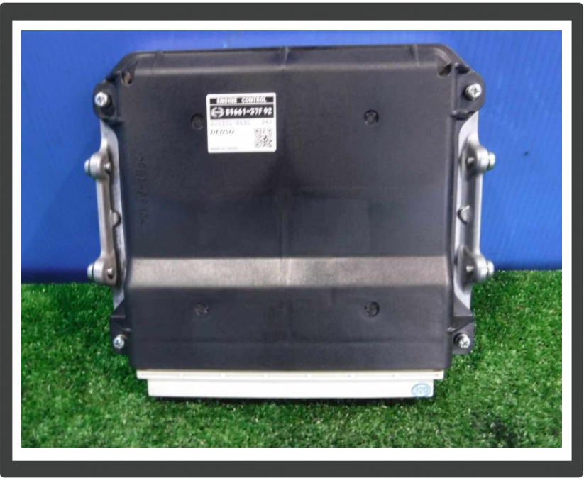
コメント エンジンコントロールユニット