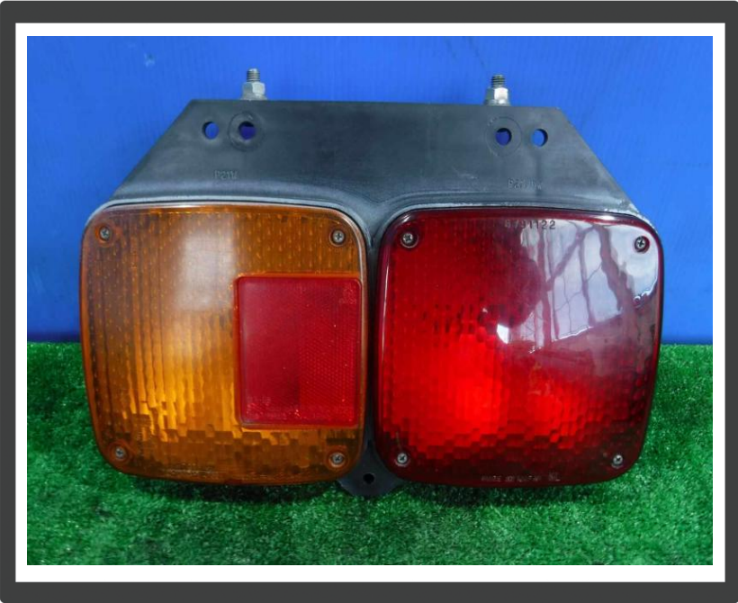
コメント 2連テールランプ