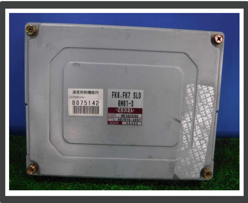
コメント エンジンコントロールユニット