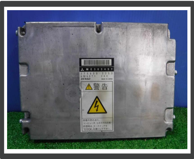
コメント エンジンコントロールユニット