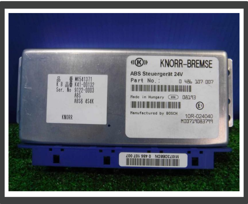
コメント ABSコンピューター