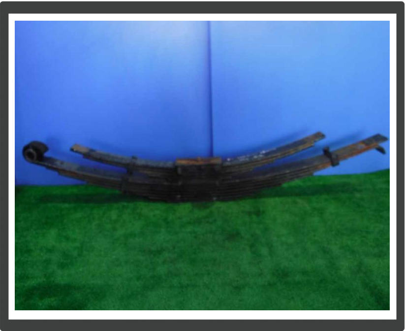
コメントメイン7枚/サブ5枚