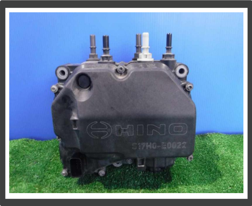
コメント ウレアポンプ