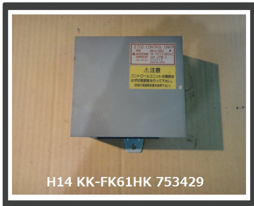
H14 KK-FK61HK 753429