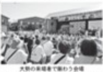
大勢の来場者で賑わう会場

人口減少がもたらす社会課題をテーマに、旭川市中央のダイハツ会場で「よろしく祭」が開催された。当日は、大勢の来場者で賑わった。会場では、人口減少対策に関するパネルディスカッションや、地域活性化のためのアイデアソンが行われた。また、子ども向けのワークショップや、高齢者向けの健康講座も開催された。この祭りは、地域住民の絆を深め、社会課題の解決に向けた取り組みを推進することを目的としている。