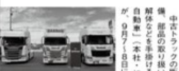
海外メーカーのスカニアトラックも展示

中古トラックの販売や整備、部品の取り扱い、解体などを手がける「金田自動車」(本社・旭川市)が、9月7・8日に設立60周年を記念した「トラックフェス」を開催した。会場となった同社「大型工場」(旭川市末広東1条12丁目1-3)には、国内外メーカーの大型トラック、ダンプ、トレーラーなど、20台以上が展示。物流や運送企業を中心に約60社、100名が来場した。会場では車両の見学や試乗が行われたほか、同社担当者と商談を行うケースも多く見られた。