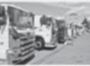
初のトラックフェス

カネタグループは、初のトラックフェスを開催し、スカニア・ボルボの魅力をPRした。当日は、同社のトラック展示場にて、国内外の最新トラックが展示された。また、整備士体験や、トラックの仕組みに関する説明も行われた。このフェスは、トラック業界の発展を促進し、消費者の理解を深めることを目的としている。