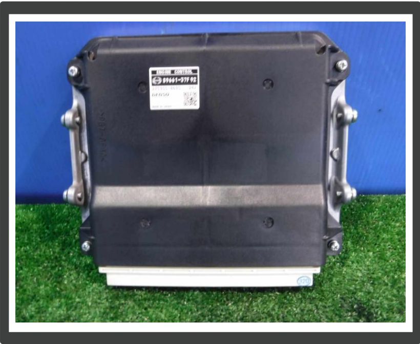
コメント エンジンコントロールユニット