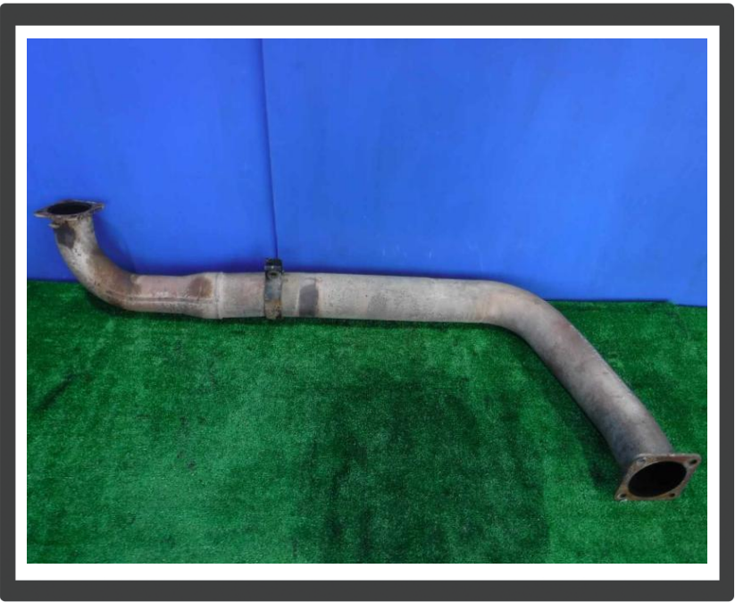
コメント マフラーパイプ左側